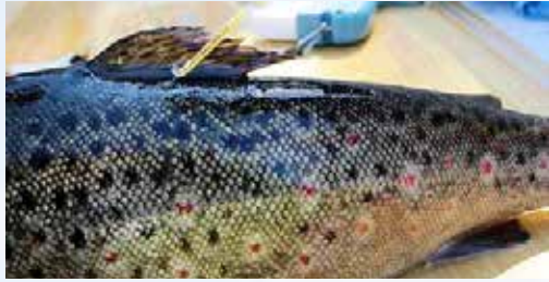
Ankkurimerkillä merkitty taimen

Päijänteen vesistöissä merkitään taimenia T-ankkurimerkein. Merkinöillä seurataan taimenten vaellusta ja kannan tilaa. Merkistä kirjoitetaan ylös koodi. Liitä koodin tiedot, kuten pyyntipaikka, paino ja pituus. Koodit voi lähettää postimaksutta osoitteeseen: LUKE, Merki, 5005751, 00003 VASTAUSLÄHETYS Lisäohjeita saat internetistä osoitteesta https://lomakkeet.luke.fi/kalamerkki