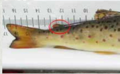
Rasvaevällinen taimen (luonnonkala)