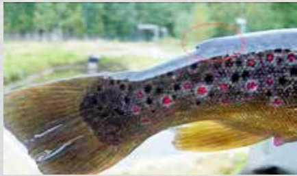
Eväleikattu taimen (istukas)

Vuoden 2016 alusta on rasvaevällinen taimen kalastusasetuksella rauhoitettu leveyspiirin 64 eteläpuolella. Sääntö koskee siis myös Päijänteen vesistöä.