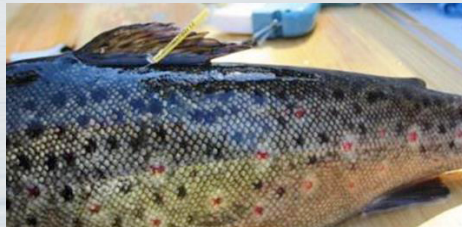
Ankkurimerkitty taimen, kuva Veli-Matti Paananen

Merkin palauttaja saa aina palkkion ja osallistuu lisäarvontoihin. Merkinnöillä seurataan kalojen vaellusta ja kannan tilaa. Merkistä kirjoitetaan ylös koodi. Liitä koodin tiedot, kuten pyyntipaikka, paino ja pituus. Koodit voi lähettää maksutta osoitteeseen: LUKE, Merkit, 5005751, 00003 VASTAUSLÄHETYS tai sähköisesti https://lomakkeet.luke.fi/kalamerkki