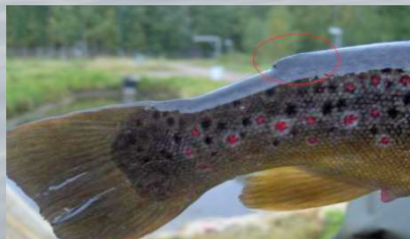
Eväleikattu taimen (istukas)

Vuoden 2016 alusta on rasvaevällinen taimen kalastusasetuksella rauhoitettu leveyspiiriin 64 eteläpuolella. Sääntö koskee siis myös Kymen ja Ruotsalaisen vesistöä.