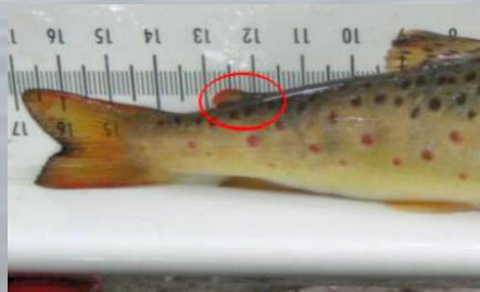
Rasvaevällinen taimen (luonnonkala)