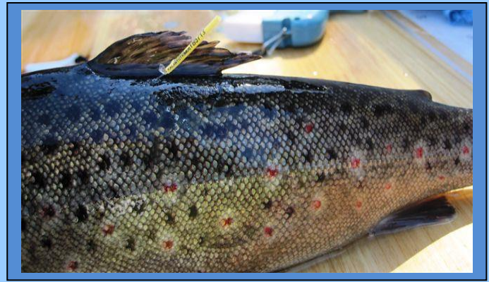
ankkurimerkillä merkitty taimen